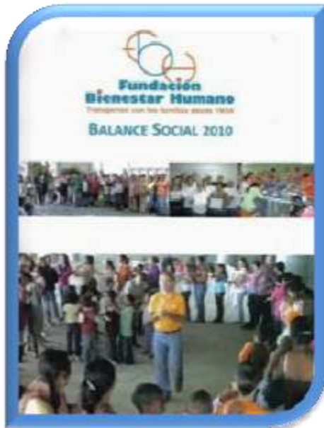
Bance Social FBH-2011